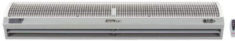
Isıtıcısız Hava Perdeleri