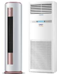
OLE-24 FSDSM / OLE-48 FSDCHM-T