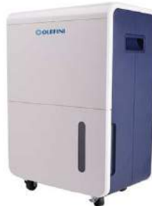
OL55-585E &amp; OL70-585E