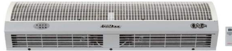
Isıtıcılı Hava Perdeleri